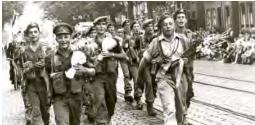
משלחת של חיילי נח"ל שזכתה במקום הראשון במסע ארבעת הימים הבינלאומי בהולנד, אוגוסט 1955