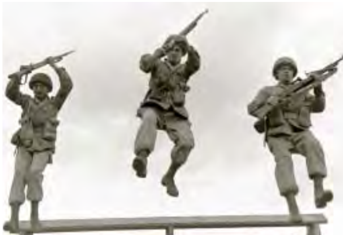
חניכים בבית הספר לקצינים של צה"ל, בה"ד 1, מאי 1953

קורס קציני החי"ר האחרון אכזבני קשות. רמת החניכים הייתה טובה ביותר, המדריכים היו אף הם מעל לבינוני, אך מפקדת בית הספר נכשלה קשות והתוצאות היו נמוכות בהרבה מן המקווה. מאחר שהקורס הזה היה ראשון להדרכה ללא שיטת התרגולת במלואה, יש רבים המנסים להצמיד הכישלון החלקי לשינוי שיטת ההדרכה. כמובן שרחוק אני ת"ק פרסה ממחשבה על שינוי השיטה, במיוחד לאור הצלחתה בכל קורסי המ"כים [מפקדי כיתות] החטיבתיים ובה"ד 2. 3 מכל האמור עד כה ודאי יובן לך שאין כוונתי לעשות שום אקספרימנטים נוספים בה"ד 1 ועלי לחתור להציב שם אדם אשר יש לו הנתונים להעלות את הבסיס. אין בה"ד 1 זקוק לקצין היודע להרבות דיבור בנושאים "פדגוגים" המרחפים בשמים מבלי יכולת ליישם במציאות, אלא לקצין המסוגל להפוך הלכה למעשה בכל השטחים – הפיקודי, ההדרכתי והחינוכי כפי שחייבים הם למצוא את ביטויים בצה"ל. בקונסטלציה הנוכחית הנך כמעט הקצין האחד אשר קנה ניסיון ותורה בארץ, השתלם בחו"ל וכה מצוי בתפיסת א[גף] ה[דנר]כה] בבעיות ההדרכה והחינוך. לפיכך ברור לי שעליך מוטלת המשימה להעלות את בה"ד 1. לדעתי תיטיב לעשות באם בסיוריך באנגליה תתרכז בבעיות הקשורות בהדרכת קצונה צעירה. אמצעי עזר בהדרכה זו, שיטות הדרכה בנושאים אשר טרם מצאנו את הדרך הטובה להעבירם ברמה זו. כמובן במידה ויתאפשר כדאי שתרחיק הסיור גם לשטחים אחרים מאחר ואין