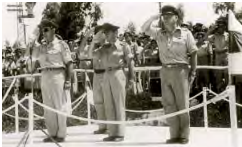
טקס סיום קורס קצינים בבית הספר לקצינים של צה"ל, בה"ד 1.

עומס העבודה והקושי המוזר המטילה עלי כתיבת מכתבים הביאה לשתיקתי הממושכת. אמנם מניח אני שמקורות אינפורמציה על הנעשה בצה"ל אינם חסרים לך כי רבה התנועה מן הארץ לחו"ל. כן היה בדעתי לחכות עד שיובהרו מספר דברים הקשורים בעתיד ולפיכך אחל בסיכום הקיים עתה לגבי תפקידך לכשתחזור לארץ. על אף תהפוכות מכל מיני סוגים דבק אני בדעתי דאז שעליך לקבל את [בסיס] הד[רכה] 1. המצב בבסיס