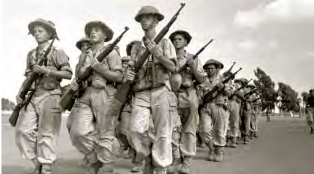
יחידה של צה"ל באימון ברובים צ'כיים (מאזר, 1898), יולי 1953