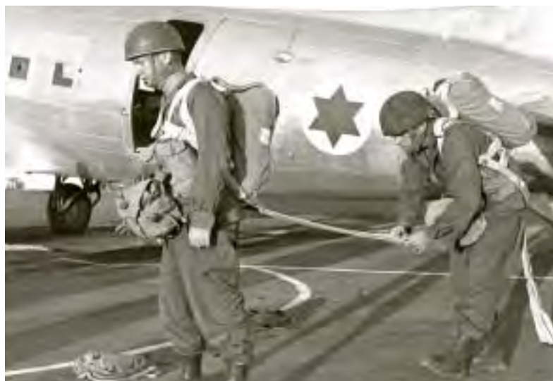
יצחק רבין לפני העלייה למטוס בקורס צניחה למפקדים בכירים, נובמבר 1954

5. כוונת מכתב זה לשמש רקע הסברתי לנושא. מספר בעיות תועלינה בהמשך המכתב ומספר רב יותר תועלינה בהמשך טיפולנו בנושא. כן בכוונתנו לשגר משלחת בת 2-3 צנחנים לביקור בארצות צרפת ואנגליה להשגת אינפורמציה באופן בלתי אמצעי. 2