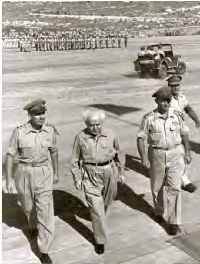
שר הביטחון דוד בן-גוריון (במרכז), הרמטכ"ל משה דיין (מימין) ומפקד מחוז ירושלים חיים הרצוג, בטקס סיום קורס קצינים בירושלים, 10 בספטמבר 1955