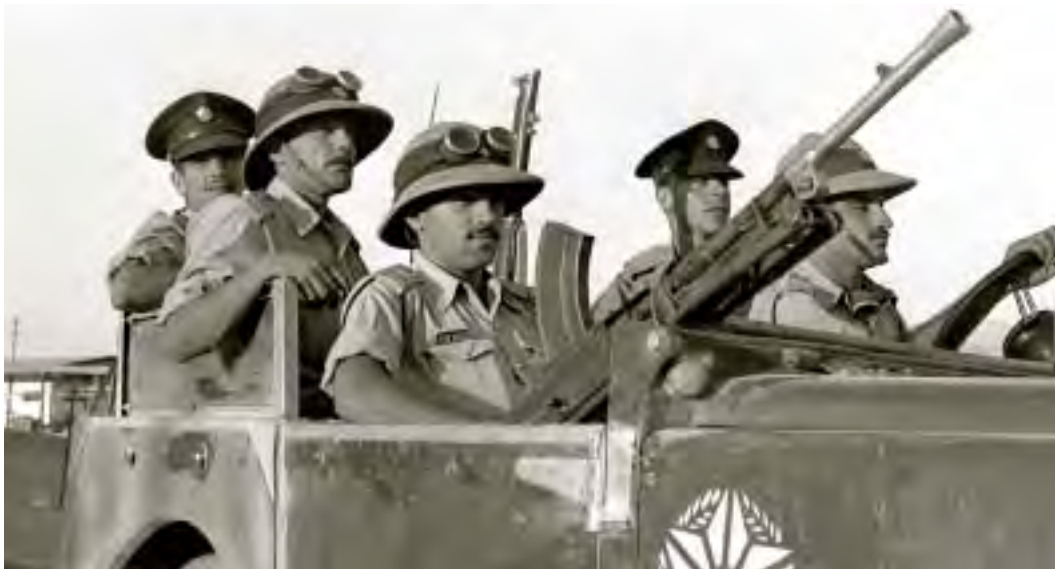
סיוור של שוטרי משמר הגבול באילת, 21 באוקטובר 1952