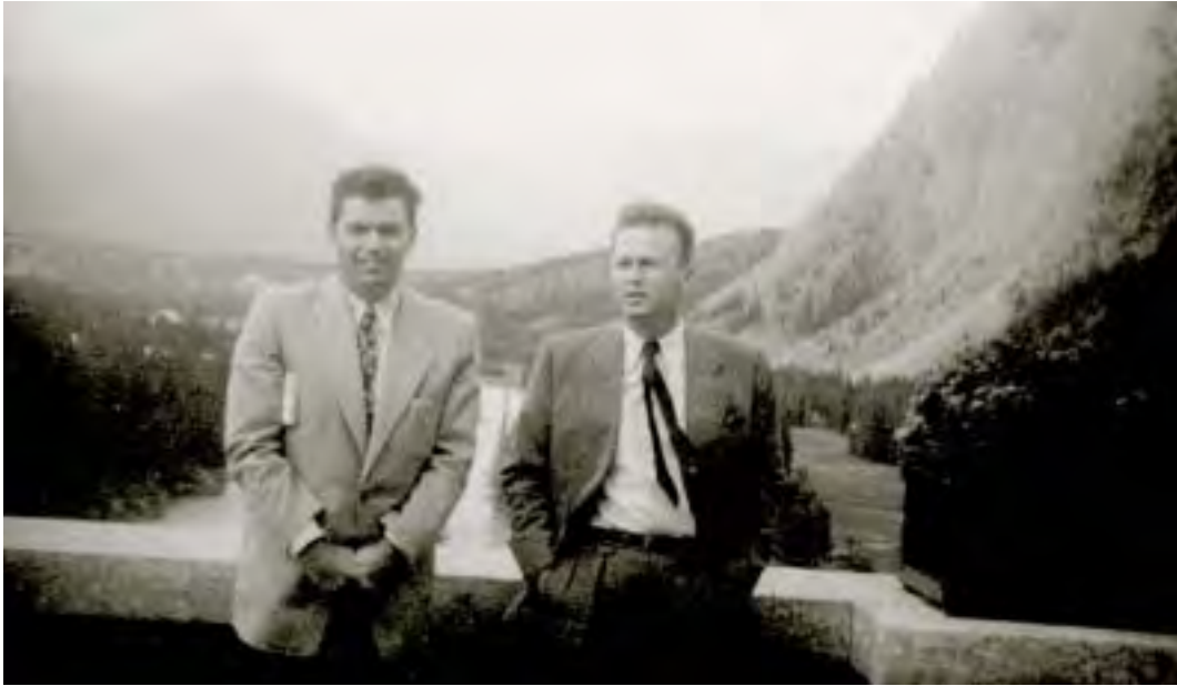
יצחק רבין ומתי פלד במהלך סיור בקנדה, יולי 1954