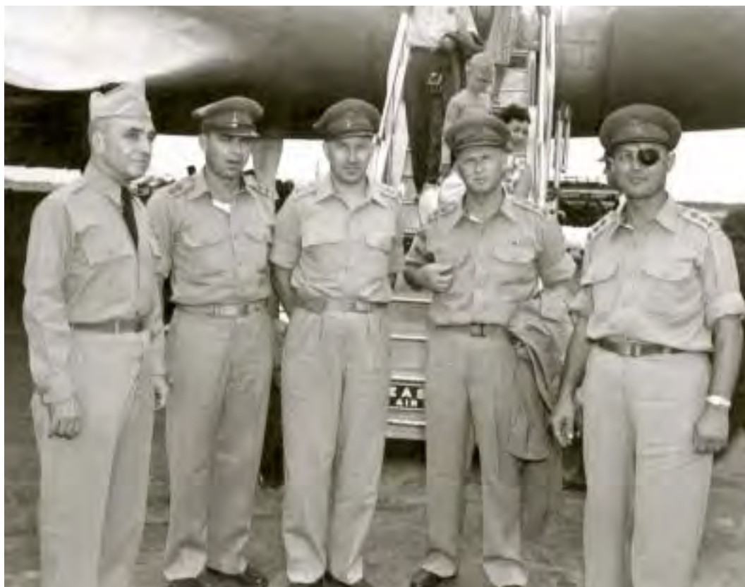
משלחת של צה"ל בביקור בארצות-הברית, יולי-אוגוסט 1954. מימין לשמאל: הרמטכ"ל משה דיין, ראש אגף הדרכה במטכ"ל יצחק רבין, הנספח הצבאי של ישראל בושינגטון חיים הרצוג והמדריך הראשי בבית הספר לפיקוד ומטה של צה"ל מתי פלד

האימונים (תיאום מדויק של הקורסים המקצועיים שלאחר הטירונות בין החילות השונים כדי לשפר את תכנון כוח האדם); שימוש בעזרי לימוד להמחשה ולפישוט של תהליכי ההדרכה; שינויים בשיטות ההוראה של כלי הנשק ועוד. אבל, כפי שרשם רבין בכתב ידו בכמה מניירות הסיכום והלקחים מן הסיור, לא הכול נמצא ראוי לחיקוי בגלל השוני הרב בגודל הצבאות, במסורת הצבאית ובהרכב האנושי של החיילים. התרשמויותיו וחוויותיו של רבין מן הביקור מוצגות בחלקן בשלושה מסמכים המובאים כאן.