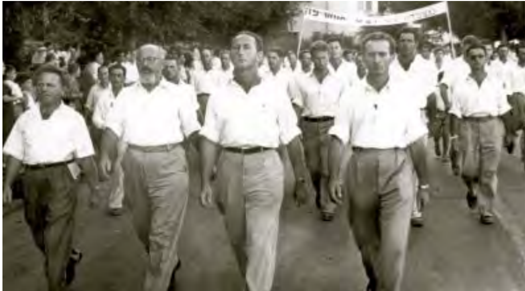
מצעד בכנס הפלמ"ח, 14 באוקטובר 1949. שורה ראשונה מימין לשמאל: אליעזר שושני, אורי ברנר, יצחק שדה וישראל גלילי. שלישי מימין בשורה השנייה יצחק רבין

ואמנם, בעיקר כתוצאה מלחץ העיתונות ודעת הקהל, נאלץ הרמטכ"ל ומשרד הביטחון לנקוט בכפפות משי, אני הוזמנתי ראשון לבירור משמעותי בפני הרמטכ"ל, הודיתי כמובן בכל "ההאשמות" והסברתי נימוקי להפרת הפקודה. קיבלתי נזיפה חמורה ואתראה שבמקרה נוסף של הפרת פקודה אועמד מיד בפני בית דין צבאי, אחרי בא מולה [כהן] שהוא נוסף לכך הודח מתפקידו, אחריו דן [נר] 3 שקיבל את העונש כמוני, ואחריו עשרות רבי סרנים מהחברה, שמרביתם קיבלו את אותו העונש פרט ליוחנן ז[ריז] 4 ורעננה [אליהו סלע] 5 שהומלץ בפני שר הביטחון על שחרורם המידי, בעיקר עקב תגובותיהם בשעת הבירור המשמעותי בפני הרמטכ"ל.