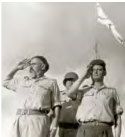
יצחק שדה ויגאל אלון סוקרים מסדר ביום פירוקה של חטיבה 8, אפריל 1949

כך שבסיכום ציון עובדות אלה אני תמה מדוע ולמה? ומתגנבים הרהורים ללבי שעלולות להיות שתי סיבות: או נימוקים אישיים כנגדי ואיני יכול להבין סיבתם, או נימוקים כנגד החטיבה בגלל מוצאה הפלמ"ח.