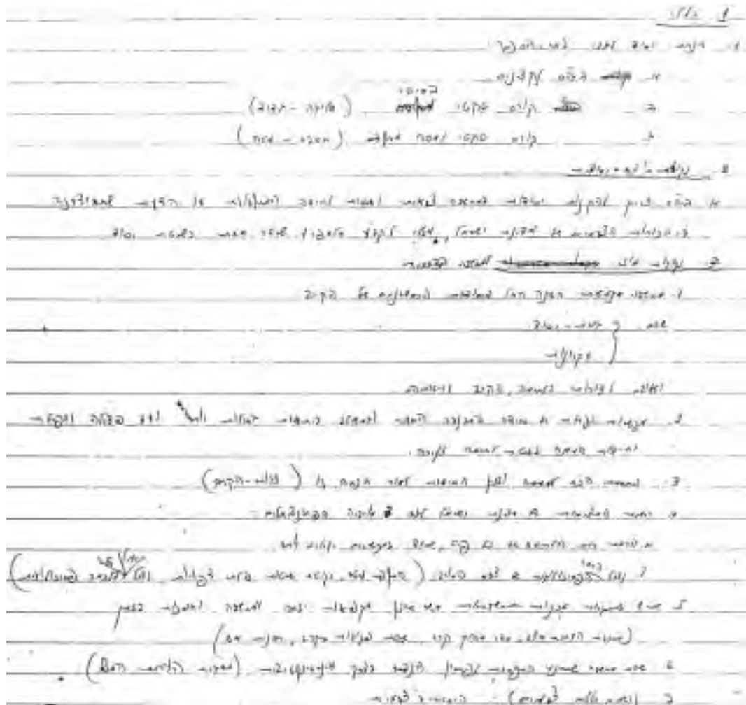
רשימה בכתב ידו של יצחק רבין מתקופת היותו מפקד בית הספר למג"דים