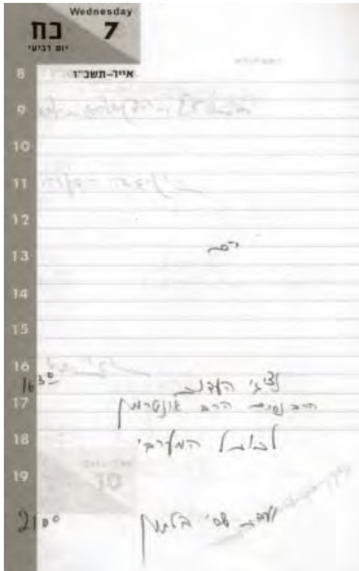
מתוך יומן העבודה של ראש הממשלה לוי אשכול, 7 ביוני 1967

הוא הציע לקבל מיד את הפסקת האש עם ירדן, שכבר הודיעה למזכיר האו"ם על הסכמתה להפסיק את האש, ולהשהות את הפסקת האש עם מצרים עד שתמסור הודעה דומה. המשך הדיון נסב על השאלה מה ניתן להספיק עד להפסקת האש וכיצד לנסח את הסכמת ישראל להפסקת הקרבות. בגין ראה דחיפות בכניסה לחברון ובכיבוש השטח עד לנהר הירדן לפני הפסקת האש, ואילו השר ברזילי היה מוטרד מהשלמת המלאכה בסיני ומכיבוש הרמה הסורית והסכים להפסקת אש עם ירדן. דיין אמר כי ניתן להסכים עקרונית להפסקת האש ועד לכניסתה להספיק להשלים את מטרות המלחמה: בגדה המערבית להגיע עד לירדן; בסיני להגיע עד לסואץ ולשארם א-שיח'; ובגזרה הסורית לבצע את תכנית המינימום של כיבוש תל עזיאת, אך לא לעלות על הרמה הסורית. הוא ציין כי חשוב ליצור קשר יבשתי בין כוחות צה"ל בסיני לבין שארם א-שיח' במקביל למשא ומתן על הפסקת האש, וחזר על עמדתו "שאיננו צריכים לשבת קרוב לתעלה". הוא הציע "לומר כן מגומגם וארוך להפסקת האש, שייתן לנו מרווח של זמן".