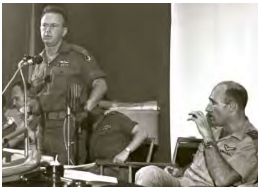
הרמטכ"ל יצחק רבין נושא דברים במסיבת עיתונאים בבית סוקולוב בתל אביב, 7 ביוני 1967. מימינו מפקד חיל האוויר מרדכי (מוטי) הוד

ב־5 ביוני בבוקר, כפי שידוע לכם, ובעצם עוד קודם לכן – היו מספר פעולות הפגזה על יישובים מהרצועה. ריכוזי כוחות איימו משם על הגבול [לאמתו של דבר לא הופגזו יישובים ישראליים ברצועה, אך בשלב זה חשוב היה להדגיש שהמתקפה הישראלית באה כתגובה על פרובוקציה מצרית; ריכוזי הכוחות אכן איימו על ישראל].