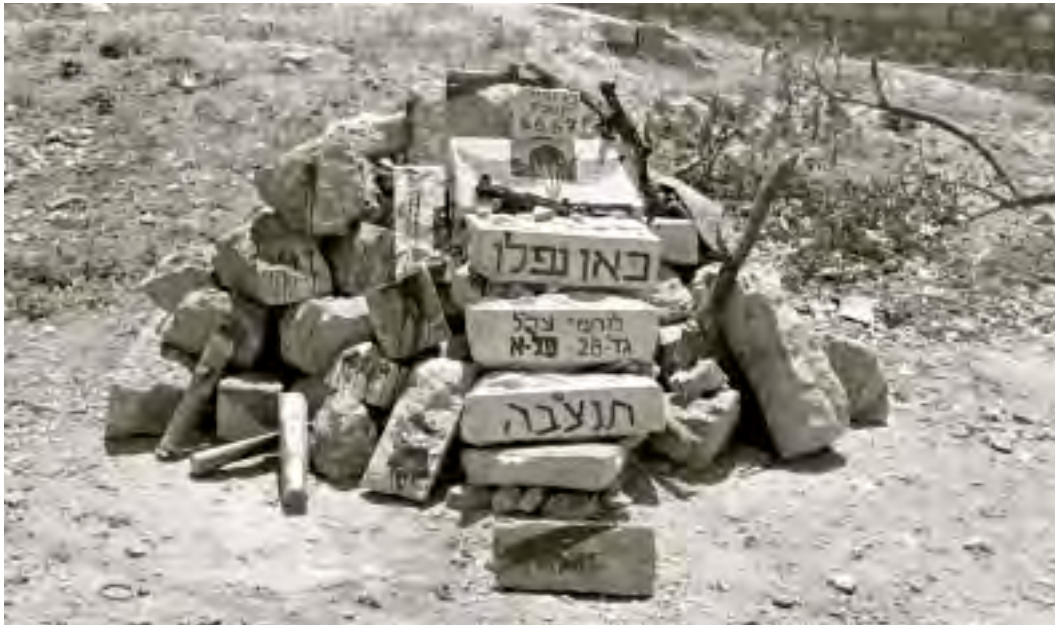
אנדרטה לחללי גדוד הצנחנים 28 שנפלו בקרב לכיבוש ירושלים

מסירת האיגרת התכנסה מועצת הביטחון ביזמת ברית המועצות והחליטה פה אחד לקרוא להפסקת אש משעה עשר בלילה. אבן המליץ לקבל את ההחלטה בתנאי שגם המדינות הלוחמות האחרות תקבלנה אותה, ולבבי צידד בעמדתו. לפני פתיחת הדיון התבקש רבין לדווח על המצב הצבאי. כשהוא מצביע מדי פעם על המפה שהייתה תלויה באולם הישיבות בתל אביב, אמר את הדברים הבאים: