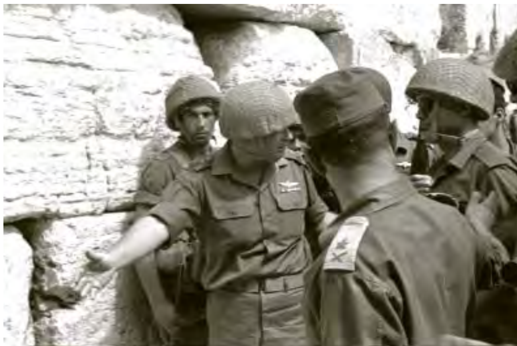
הרמטכ"ל יצחק רבין (שני משמאל), שר הביטחון משה דיין (ראשון מימין) ואלוף פיקוד מרכז עוזי נרקיס (עם הגב למצלמה) ליד הכותל המערבי בעיר העתיקה בירושלים, 7 ביוני 1967

והיא תקיים את העם היהודי לדורות". הוא בירך את ראש הממשלה, את שר הביטחון, את הרמטכ"ל ואת צה"ל, ולאחר עמידה לזכר הנופלים הורמו כוסות "לחיים".