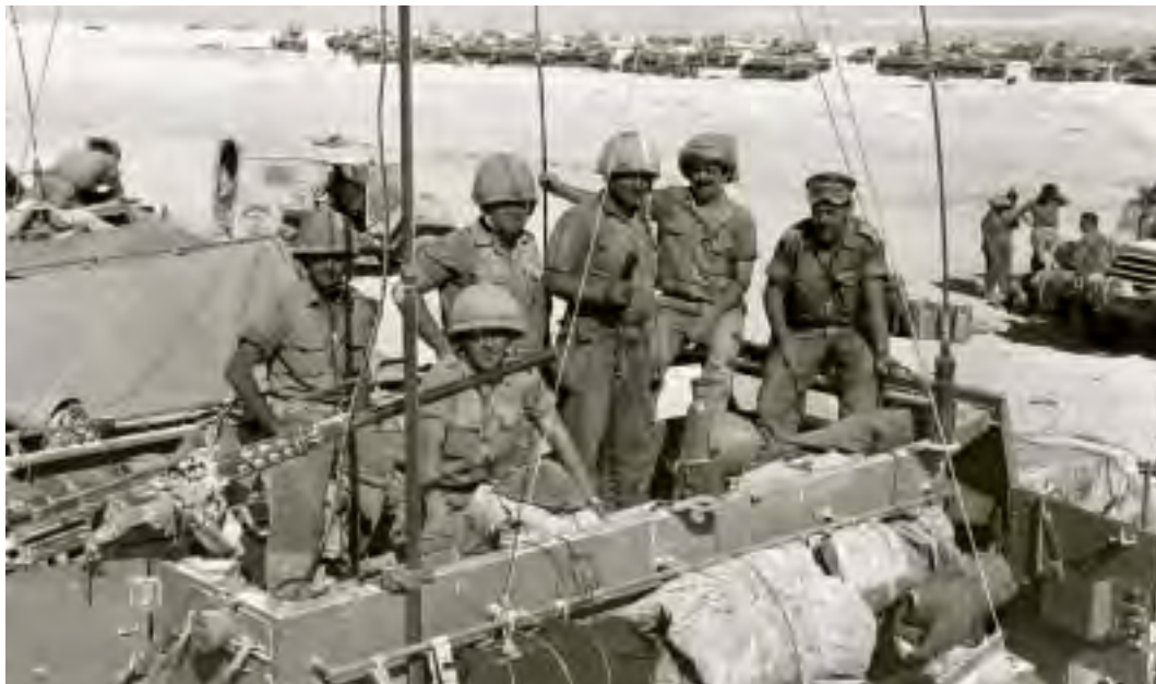
יחידה של צה"ל בחניון בסיני בדרך אל תעלת סואץ, 8 ביוני 1967

באותו לילה התיר לעצמו רבין "מעשה של מותרות" – לאחר חמישה ימים "סחוט ועייף עד כלות כל הכוחות" הלך לישון בביתו (פנקס שירות, עמ' 199).