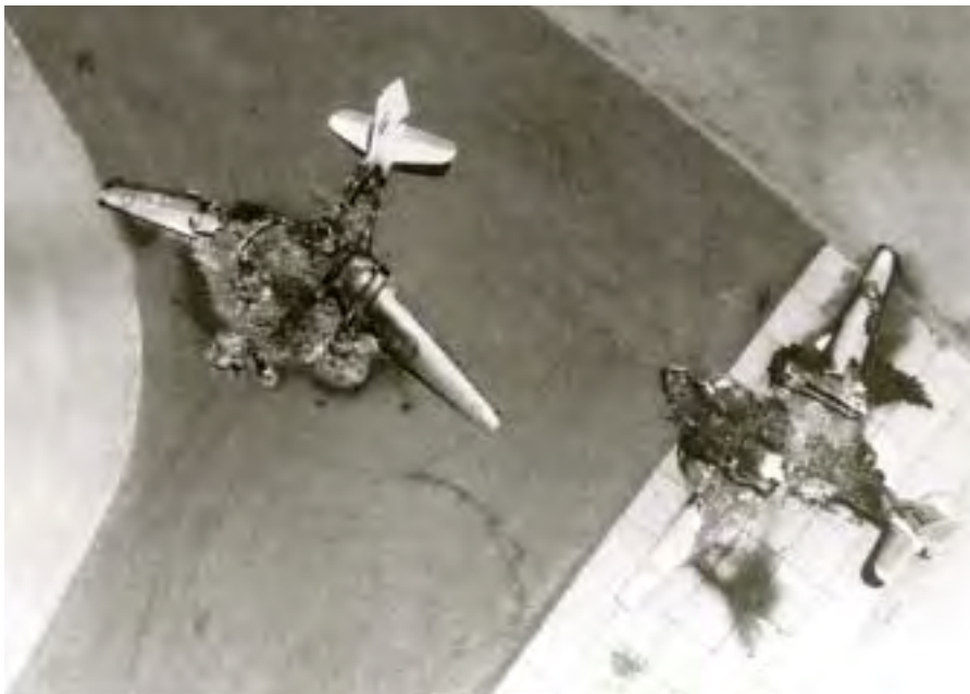
מטוסי קרב מצריים שהושמדו על הקרקע על ידי חיל האוויר הישראלי, 5 ביוני 1967

בשעה 07:45 החלה, בדממת אלחוט, התקפת חיל האוויר על שדות התעופה המצריים. רבין, ברלב, ויצמן, הוד, דיין וקצינים בכירים של חיל האוויר היו במוצב הפיקוד של חיל האוויר ועקבו אחרי ההתקפה האווירית. לאחר שעה הגיע אשכול בלוויית אלון ודינשטיין ושמע דיווח על ההתקפה. באותה שעה כבר הושמדו חלק משדות התעופה המצריים. חלקם האחר הושמדו בגל ההתקפה השני ואחריו הותקפו גם שדות התעופה של ירדן וסוריה. בדיונים המקדימים לפני פתיחת המתקפה האווירית קבע רבין כי יש להימנע מיזמה מלחמתית בגזרות ירדן ובסוריה, אך הורה להעביר את מרב השריון של פיקוד צפון לגזרה הירדנית. כשעה לאחר תחילת המתקפה האווירית החל הקרב על הקרקע בהתאם לפקודת "נחשונים". אוגדת טל יצאה לקרב הבקעה של המערך המצרי בציר הצפוני רפיח-אל-עריש; בציר המרכזי פרצה אוגדת שרון לכיוון מתחם אום כתף-אבו עגילה; ואוגדת יפה נעה בציר שביניהן לכיוון צומת ביר לחפן.