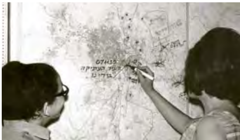
מפת ההתקדמות של כוחות צה"ל לכיבוש ירושלים המזרחית

במהלך היום והערב נכבשו טול כרם, שכם ויריחו; ובדרום הגיעו הכוחות עד למעברי הגידי והמתלה; חיל הים ויחידת צנחנים הגיעו בצהריים לשארם א־שיח' ומצאו את המקום ללא כוחות מצריים. היחידות התקדמו עד לאבו רודס ולמפרץ סואץ.