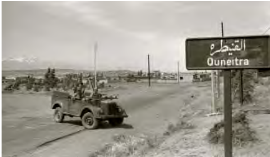
חיילים ישראלים על רכב שלל סורי במבואות העיר קוניטרה ברמת הגולן, יוני 1967

חיל האוויר לשתק את הארטילריה הסורית, שמחופרת בעמדות מבוצרות. הוא הציע לאיים על הסורים שאם ימשיכו בהפגזות תפציץ ישראל את דמשק. השרים התנגדו להצעה. חלק מן המשתתפים ובהם עמית הציעו להפסיק את הלחימה עם בוקר. בסופה של הישיבה הוחלט להמשיך בלחימה עד הצהריים ועד אז להשלים את כיבוש האזור הצפוני, ולא להתחיל בפעולה בדרום הרמה; אם לאחר הפסקת האש בשעה שתים-עשרה בצהריים ימשיכו הסורים להפגיז את היישובים, נאמר, תפגיז ישראל יישובים בסוריה; ואם לאחר הפסקת האש ימשיכו הסורים לתקוף את הכוחות הישראליים, ישתדל הצבא לכבוש את השטח בעומק הרמה שבו נמצאות סוללות התותחים הסוריות, כדי להוציא את היישובים מטווח הארטילריה הסורית.