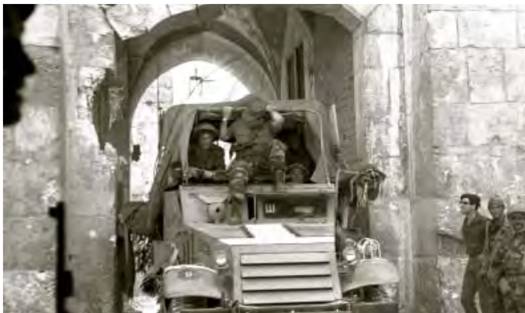
זחל"ם ישראלי עובר דרך שער האריות בעיר העתיקה בירושלים, 7 ביוני 1967

שלנו. זה לא אומר שכולם כשירים לפעולה. במקום אחד נתקלנו בחטיבה משורינת ובטנקים, שהם מובילים אותם לעבר התעלה, ואלה טנקים שאינם יכולים להילחם. בחלק זה כל הצירים פתוחים. הצרות הכי גדולות הן ברצועה. בכיבוש רצועת עזה היו לנו כשישים הרוגים, וזה בעיקר בידי צלפים. יש שם שתי חטיבות פלסטיניות, שהן בערך כ-4,000 איש, והם כל הזמן השתמשו בפגזים. זה לגבי הדרום.