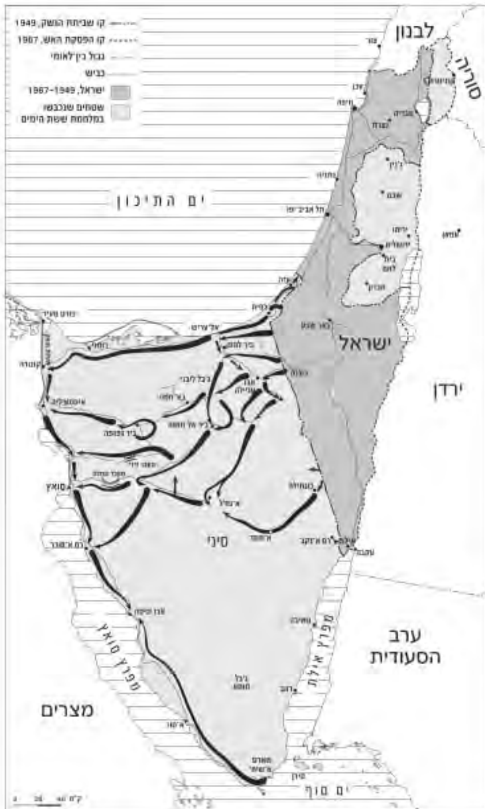
מפת ההתקדמות של כוחות צה"ל בסיני והשטחים שנכבשו במלחמת ששת הימים, 6-10 ביוני 1967