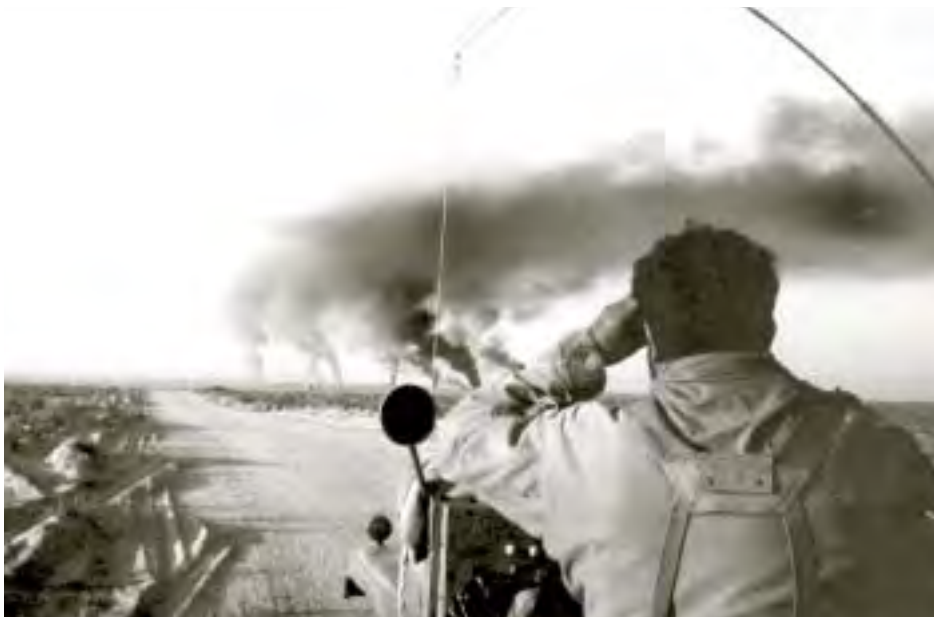
טנקי T-55 מצריים בווערים לאחר שנהדפה התקפתם בסמוך לתעלת סואץ בציר קנטרה-איסמעליה, יוני 1967

היום נמצאים אנו למעשה כאשר עיקר הצבא המצרי בסיני מובס, כאשר ישנם אמנם קרבות שהיה פה ושם, כאשר כל מאמצי חייליו להיחלץ אל מעבר לתעלה וכאשר כוחותינו מטפלים בהם.