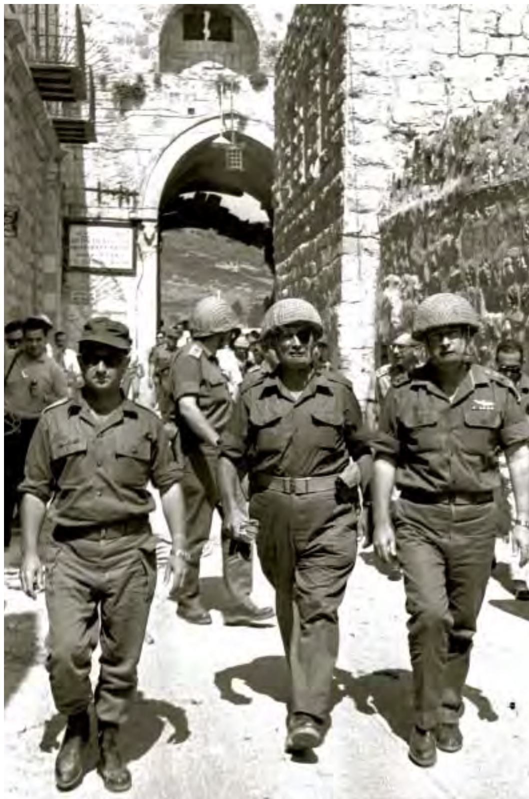
שר הביטחון משה דיין (במרכז), הרמטכ"ל יצחק רבין (מימינו) ואלוף פיקוד מרכז עוזי נרקיס נכנסים לעיר העתיקה בירושלים דרך שער האריות לאחר כיבושה, 7 ביוני 1967