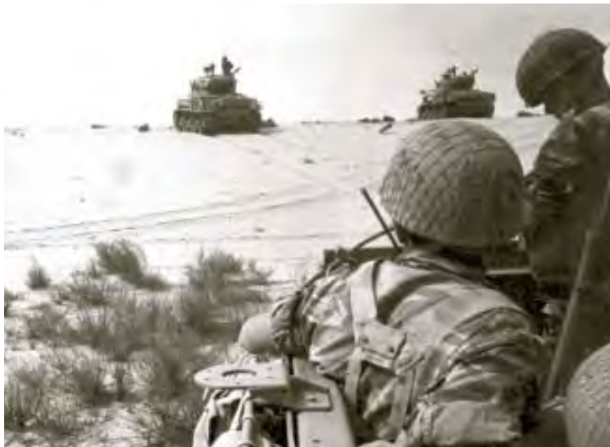
כוח שריון ישראלי נע לעבר אל-עריש במלחמת ששת הימים