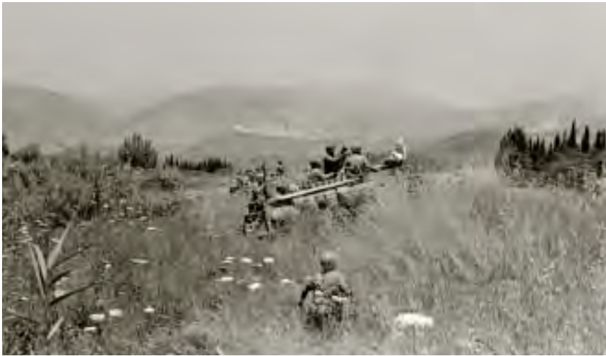
יחידה של צה"ל ברמת הגולן, יוני 1967

כשחזר רבין למוצב הפיקוד העליון כבר התנהלו התייעצויות מדיניות עד כמה ניתן יהיה למשוך את הלחימה לאחר ששני הצדדים כבר הסכימו להפסקת האש ולאור כינוסה הצפוי של מועצת הביטחון. בשעה שמונה בערב התקיימה ישיבה של ועדת השרים לענייני ביטחון בהשתתפות השרים שהיו בתל אביב. דיין מסר כי נתן הוראה חמורה לסיים את הקרבות ברמה הסורית עד אור הבוקר. הוא דיווח כי הסורים לוחמים כאריות ואינם נסוגים. עד כה, אמר, הצליח צה"ל לכבוש את אזור הבניאס, ובדרום ניסה חיל הרגלים לכבוש את תאופיק כדי להגיע לכפר חארב שברמה. דיין ציין כי הסיכוי לבצע את המשימה האחרונה עד אור הבוקר קלוש, וכי אם הסורים ייצאו להתקפה נגדית יהיה צורך לתגבר את הכוחות. אבן דיווח על החלטה פה אחד של מועצת הביטחון שעד לשעה עשר באותו לילה על הצדדים להודיע למזכיר האו"ם על הסכמתם להפסקת אש. הוא הציע להסכים להפסקת אש בתנאי שגם הסורים יפסיקו את האש ולנסות להרוויח עוד כמה שעות של לחימה. אשכול הביע חשש מפני התפארות של סוריה שישראל לא הצליחה לגבור עליה. בדיון הובע חשש גם מפני תגובת ברית המועצות, אך מנהל משרד ראש הממשלה יעקב הרצוג אמר כי מוטב ניתוק יחסים עם ברית המועצות מאשר להשאיר את הרמה בידי הסורים.