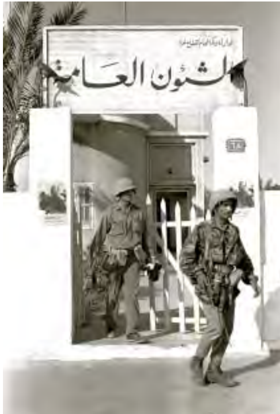
חיילים ישראלים בפתח משרד התעמולה של אחמד שוקיירי בעזה, 6 ביוני 1967

לאחר תום הקרבות, ואמר שהמטרה של ישראל היא להפסיק את מצב הלחימה עם שכנותיה. לגבי הגבול הצפוני תהא אם לא הגיעה העת "לתקן משהו בענייני המים היותר רחוקים: הבניאס ואולי גם הליטני, במקום שנצטרך אולי לשפוך עוד דם רב אחר כך", והבהיר ש"יש שאלה של כיבוש הבניאס, תל עזזיאת, הרמה, והשטחים המפורזים...".