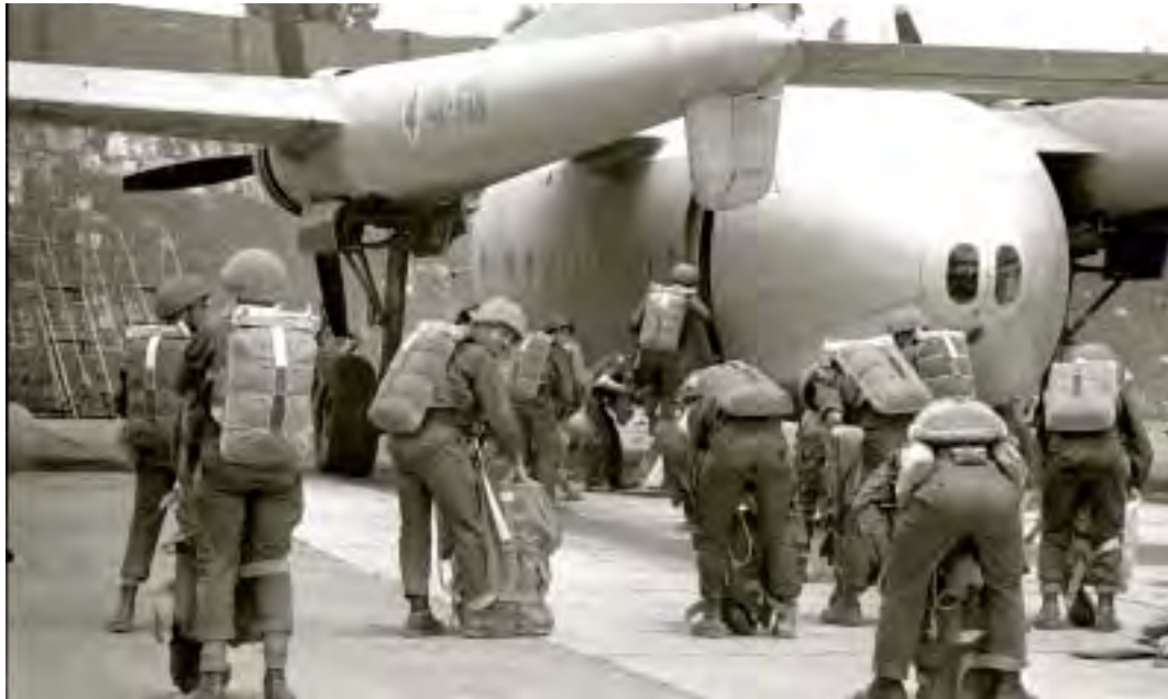
חיילי חטיבת המילואים 55 של הצנחנים עולים על מטוס לקראת משימת צניחה בסיני, זמן קצר לפני שהפקודה שונתה והחטיבה נשלחה להילחם בירושלים, 7 ביוני 1967