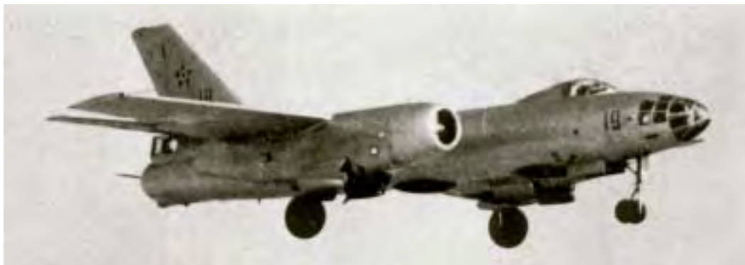
מפציץ סילוני קל IL-28 (אליושין) מתוצרת ברית המועצות, שהיה בשירות חילות האוויר של מצרים, סוריה ועיראק

הכוחות, חשוב שאקדים להם כמה דברים שאמרתי בפעם הקודמת, כי בשביל לנתח את יחסי הכוח או עיקר המשמעויות של יחסי הכוחות, חשוב לזכור מה הם עיקרי הלחימה של צה"ל, כפי שצינתי בפעם הראשונה. אמרתי שתפקידו של צה"ל בראש וראשונה להרתיע בפני ביצוע פעולות איבה נגד ישראל. במידה וכוח ההרתעה לא יעמוד, יהיה בזה תלוי כוח צה"ל לענות על הערכת כל אלה אשר ינסו בכך. מהותו של כוח מרטיע בתנאים שלנו ביכולתו למנוע את האויב מלהשיג את משימתו. כלומר, בשביל לקיים כושר הרתעה אין די ולא מספיק ביכולת למנוע את הצד השני [ל]השיג את משימתו. כוח הרתעה מוכרח להיות מושתת על יכולתו של צה"ל לא רק למנוע את הצד השני [ל]השיג את המטרה, אלא בראש וראשונה להביא להכרעתו, הרס צבאו, הרס משטרו.