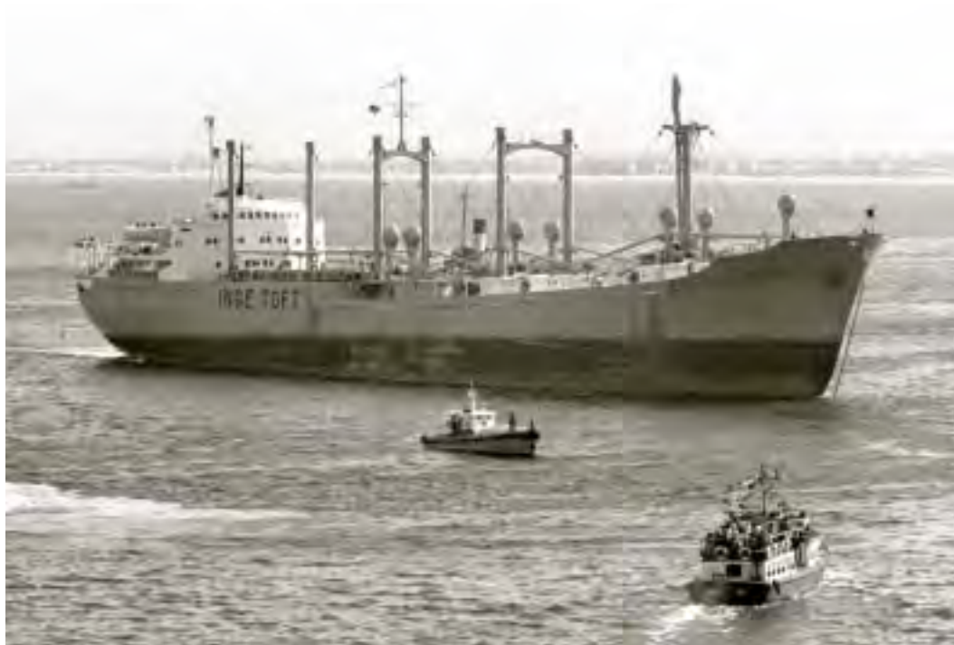
האנייה "אינגה טופט", פברואר 1960

בחובם חומר נפץ ביטחוני. השקט השורר עתה נוח ונעים והם מבכרים לטמון ראשם בחול כבת היענה ולהתעלם מן העובדות הצפויות בעת [צרה].