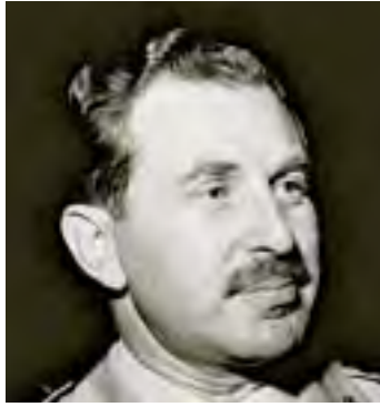
ראש אמ"ן חיים הרצוג, יוני 1959