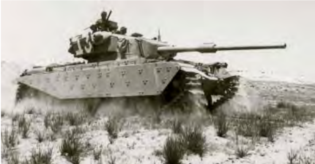
טנק סנטוריון מתוצרת בריטניה שהותקן בו תותח 105 מ"מ מתוצרת ישראל

(ב) להציע לצרפתים להמשיך בגלגול העסקה תוך החלפת מקבלי הסנטוריונים ונותני הדולרים, קרי שאנו נהיה בקצה הסופי של המעגל במקום המצרים.