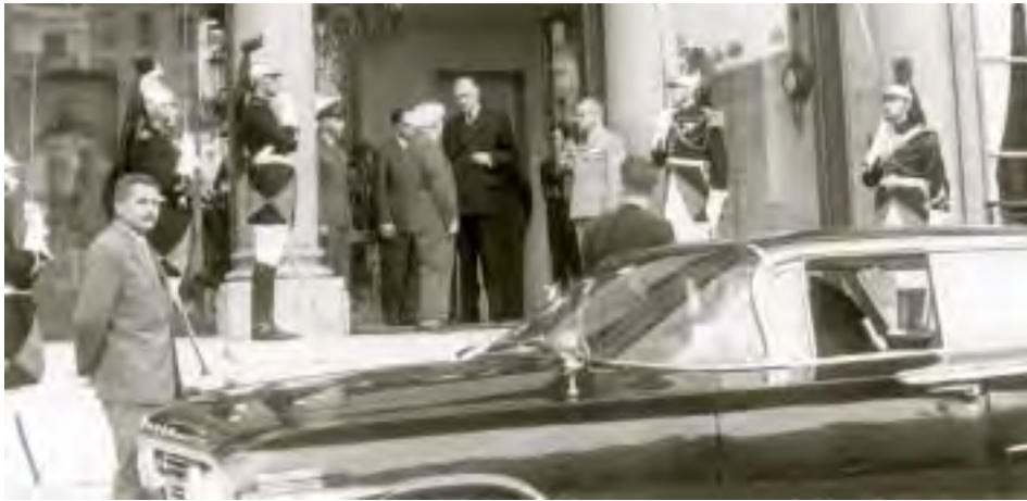
נשיא צרפת שרל דה־גול מקבל את פני ראש ממשלת ישראל דוד בן־גוריון בארמון האליזה בפריז, 14 ביוני 1960

קיים נושא עדין שני. הדבר קשור בנסיעתו של הרמטכ"ל [חיים לסקוב] לביקור באלג'יר. הזקן מהסס ולפי דבריו בגלל המשמעות המדינית של ביקור רמטכ"ל ישראלי באלג'יר. היסוסו החל לאחר שאישר בתחילה הנסיעה ובהתאם לכך אף הודיעך הרמטכ"ל על כך חיובית. לדעתי כדאי להשפיע עליו בכיוון חיובי. הדבר אינו קשור רק ב"תרומה" לטובת הרמטכ"ל הנוכחי, אלא לדעתי עצם קביעת תקדים ועתה של ביקור הדרג הצבאי הגבוה ביותר בצה"ל בצבא צרפת הנו בעל חשיבות להמשך המגעים בינינו לבין הצרפתים ואין חשיבות לגבי נושא זה מי האדם המכהן בתפקיד הרמטכ"ל. במידה ויועלה הנושא הרי לדעתי כדאי שתתרום בכיוון חיובי בנושא זה. 1