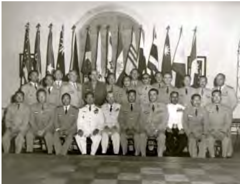
יצחק רבין (יושב שני משמאל) בחברת אנשי צבא שהשתתפו בקורס להכרת נשק חדיש שערך צבא ארצות־הברית בפורט בליס, 6 בספטמבר 1960

קיבלתי היום את מכתבך לאחר שחזרתי הנה מביקור בן 3 ימים במקסיקו סיטי, כמובן יחד עם צ'רה [צבי צור]. הקורס עצמו טוב ומעניין הן מבחינת התוכן והן מבחינת החניכים, אין לי כלל מה להעיר על צורת מסירת החומר, קרי ההדרכה על ידי האמריקאים. קשה ממש להאמין למראה עיניך ולמשמע אוזניך באשר לרמת ההדרכה הגבוהה, הליטוש שבדיבור והשכלול שבעזרי האמון העושים פשוטים דברים כה מסובכים. תוכן הקורס נחלק לשלושה חלקים. החלק הראשון הוא הרקע. תפקידו לתת את עיקרי התפיסה האסטרטגית והטקטית של צבא (ליתר דיוק כלל הכוחות המזוינים) ולהבליט יישומה של תפיסה זו, במיוחד לגבי כוחות היבשה בארגון ותפעול החל מרמת הנשיא וכלה ברמת ה־Battle group. 1 לגבי פרק זה היה מאוד מעניין ואם כי באופן טבעי היה מאוד כולל הרי מבחינתי דווקא בכך הייתה החשיבות. אין לי כל רצון לעסוק בטבלאות מטה של צבא ארצות־הברית. אני מעוניין יותר להבין את הרעיון המונח ביסודו של הארגון והמחשתו בשיטת תפעול כללית. החלק השני עסק בפרשת הקליעים, כמובן בעיקר אלה המצויים בידי כוחות היבשה. כלומר קרקע-קרקע עד 400–500 ק"מ וקרקע-אוויר. כמובן גם לכאן קדם פרק כללי המציג את היסודות המשותפים לכל הקליעים וכמובן מתן תמונה כללית על הקליעים המצויים בידי השירותים האחרים. פרק זה היה מעניין במיוחד וחזינו גם במטווח קליעי [גד] [מ]טוסים [מטיפוס Nike על שני סוגים המצויים מבצעית בשוק ההרקולס