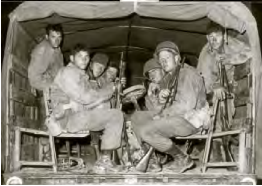
חיילים מחטיבת גולני אחרי הפשיטה על תאופיק, 1 בפברואר 1960