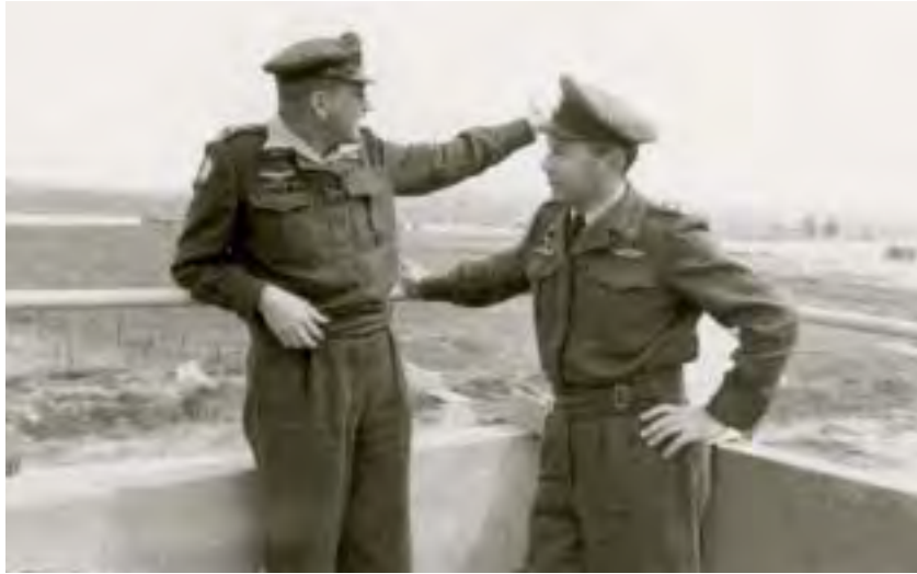
מפקד חיל האוויר עזר ויצמן וממלא מקומו גדעון אלרום, חורף 1958