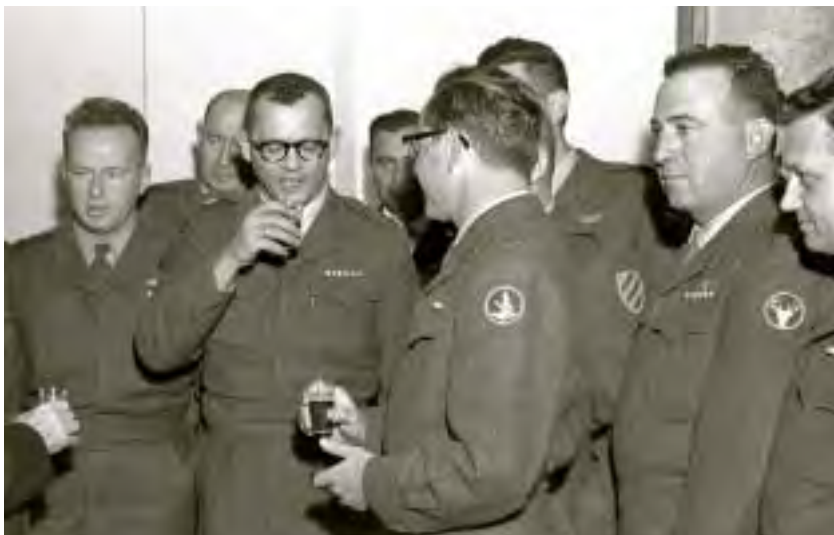
טקס חילופי הרמטכ"לים במשרד ראש הממשלה בירושלים, 1 בינואר 1961. משמאל לימין: ראש אג"ם יצחק רבין, אלוף פיקוד דרום אברהם יפה, הרמטכ"ל היוצא חיים לסקוב, מפקד חיל הים יוחאי בן-נון, הרמטכ"ל הנכנס צבי צור, אלוף פיקוד צפון מאיר זורע וראש אג"א משה גורן